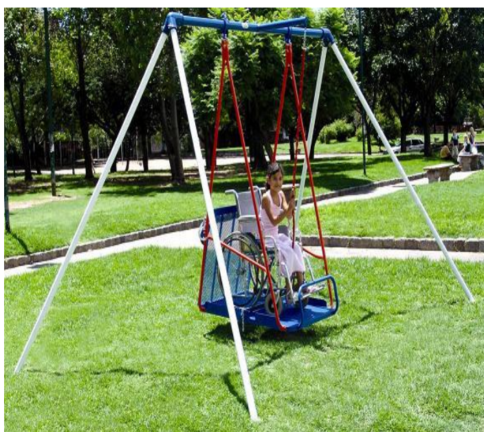
Hamaca para sillas de ruedas

A modo de ejemplo, en este anexo se acompañan imágenes meramente ilustrativas de algunos juegos que se encuentran instalados y a disposición de las personas que quieran utilizarlos, en distintas plazas de la Argentina.