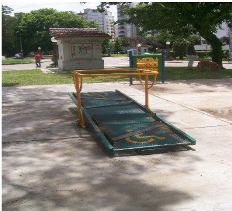
Sube y baja para sillas de ruedas