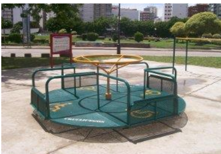
Calesita para sillas de ruedas